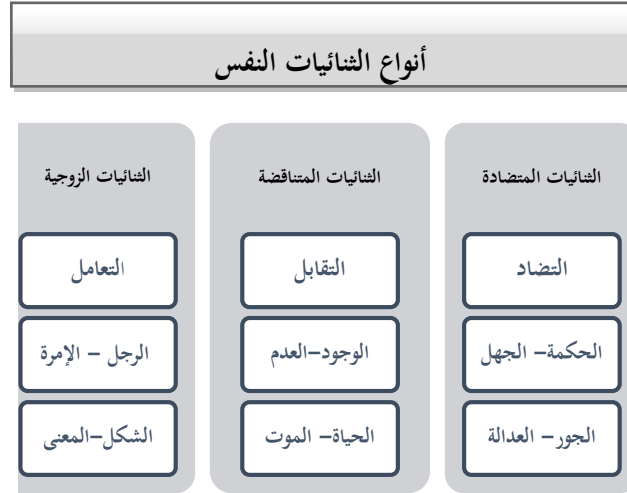
الشكل ١. أنواع الشائيات النفس

لكن نظام التوازن في نفس الإنسان غير محدود بهذه الصفات، فالنفس الإنسانية متعددة الأطوار ومتفاوتة دائماً في أثناء صراع هذه القوى والصفات الأخلاقية. إذاً يمكن القول إن