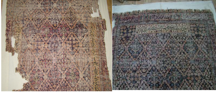
الصورة رقم ٧- أ: النصف السالم نسبيا من السجادة الموقوفة، محل الاحتفاظ: المتحف الوطني الإيراني، الباحثة الصورة رقم ٧- ب: ( اليسار) النصف المتضرر من السجادة الموقوفة، محل الاحتفاظ: المتحف الوطني الإيراني، الباحثة

بسبب شبكة المعين في جميع أنحاء السجادة يتجلى نوع من النظم والتطابق في كافة أنحاء السجادة. لكن في التفاصيل كأنواع الشجر والورود وباقي العناصر التزيينية نجد نوعا من عدم التطابق والانسجام. إن المصمم أو الناصح قد اختار اللون الرملي بشكل ناجح للكتابة التي دونها على السجادة وهو أمر أدى إلى أن يكون النص واضحا للقراءة.