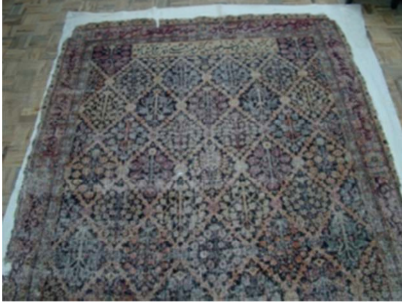
الصورة رقم ٣. السجادة الموقوفة والموجودة في المتحف الوطني

السجادة المذكورة يحتفظ بها حاليا في المتحف الوطني برقم ٢٠٢٩٤. الصورة رقم ٣ هي للسجادة الموقوفة والتي ندرسها في هذا البحث.