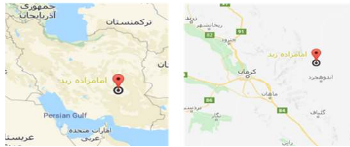
الصورة رقم ٤- أ. الضريح المقدس للإمام زاده زيد، شهداد، كرمان