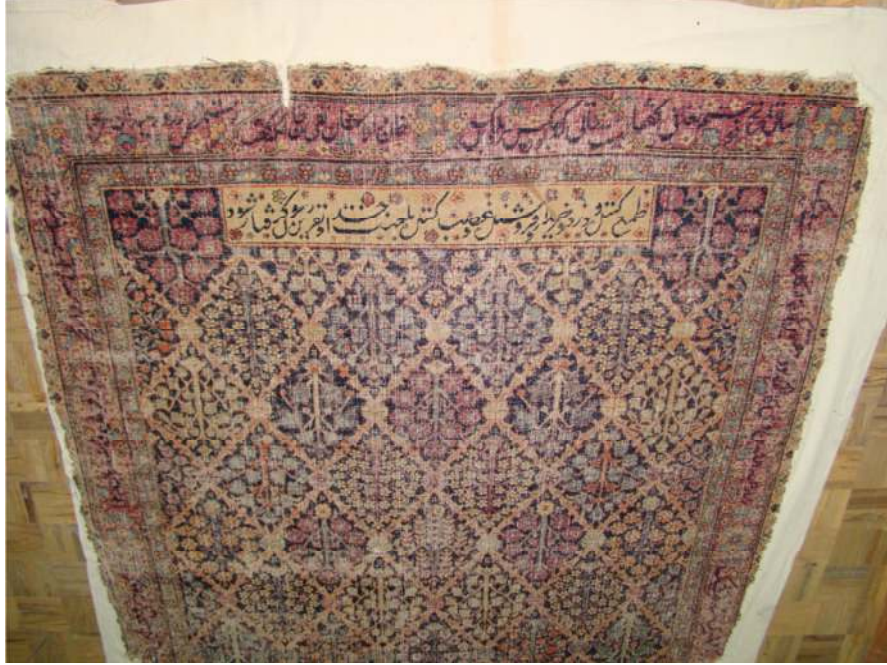
الصورة رقم ٢. سجادة موقوفة في عصر كريم خان زند (١١٩٣-١١٦٣ ق)، الباحثة

إن السجادة الموقوفة والمحتفظ بها في المتحف الوطني وباعتبارها وثيقة للوقف تتضمن مثل باقي الموقوفات أجزاء مختلفة كاسم من قام بالحبس والموقوف والموقوف عليه، وشروط الوقف والوسائل. تشكل هذه الأجزاء كيان السجادة الموقوفة.